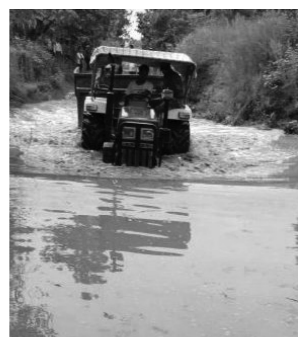
भइरहेका छन्। तर, पनि सम्बन्धित निकायको बेवास्ताका कारण सडक सुधार हुन सकेको छैन। सडक कालोपत्रेको जिम्मा पाएको निर्माण कम्पनीको लापरवाही र ढिलासुस्तीका

खाल्डाखुल्डी र अहिले वर्षात्मा हुलाकी सडक रोपाईका खेतजस्तै हुने गरेको छ। पूर्वभेची हुँदै पश्चिम महाकाली जोड्ने हुलाकी राजमार्गअन्तर्गत कञ्चनपुरको बेल्डाँडी दैजी सडकखण्ड सबैभन्दा बढी दयनीय बनेको छ। शुक्लाफाँटा राष्ट्रिय निकुञ्ज भएर बेल्डाँडीदेखि दैजी महेन्द्र राजमार्गसम्म सडकको अवस्था नाजुक बन्दै गएपछि उक्त सडकमा यात्रा सकसपूर्ण बनेको छ। हुलाकी सडकको ठाँउ-ठाँउमा खाल्डाखुल्डी परेका छन्। यो सडक हेर्दा रोपाई गर्ने खेतजस्तै बनेको देखिन्छ। पानी परेका दिन सडक होइन, रोपाईका लागि तयार पारेका खेतजस्तै हुने भएकाले यात्रुले ज्यानको बाजी थापेर जोखिमपूर्ण कष्टकर यात्रा गर्नुपर्ने बाध्यता सिर्जना भएको छ। वर्षादेखि सडक सुधार नभएका कारण दक्षिणी क्षेत्रका जनता यातायात सेवाबाट वञ्चित भएका छन्। कच्ची सडक भएका कारण बेला बेलामा सवारीसाधन दुर्घटना