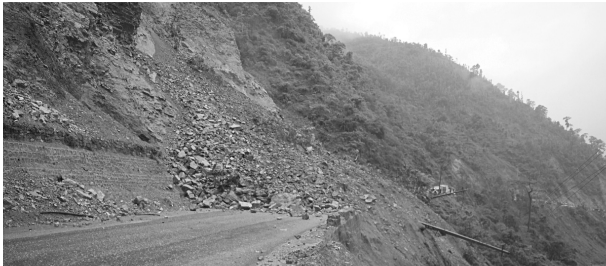
नारायणगढ-मुठिन सडकखण्डको ठोपे खोलामा सोमबार खस्केको पहिरो, बर्खायामाका दैनिकजसो खस्ने पहिरोले यात्रुलाई निकै आस्ती हुने गरेको छ।

खेतीमा प्रविधि र आधुनिक तरिकाले उत्पादन बढाई आर्थिक समृद्धिका लागि अगाडि बढ्न युवालाई अनुरोध गरेका थिए।