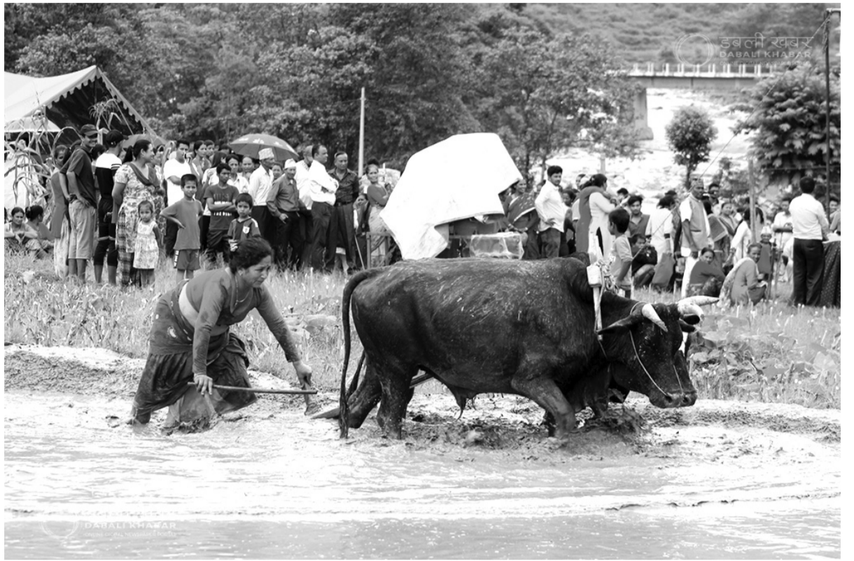
के कम : नुवाकोटको तुप्नेमा असार पन्ध्रको अवसरमा धान रोप्नका लागि खेतमा बाँदै लगाउँदै महिला । महिलाहरूले हलो र जुवा छुन हुन भन्ने मान्यतालाई यहाँका महिलाले चुनौती दिँदै हलो जोत्ने र बाँदै लगाउन सक्षम छन् भन्ने उदाहरण दिएका छन् ।