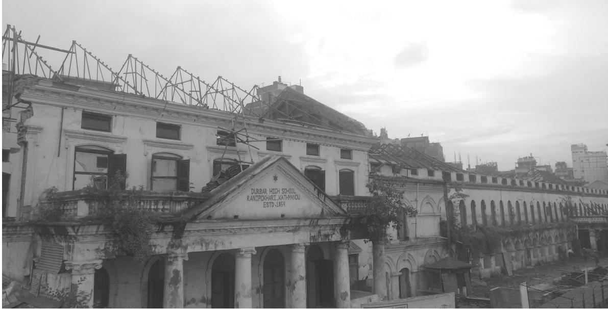
२०७२ सालको भूकम्पपछि बल्ल पुननिर्माणको चरणमा रहेको दरबार हाइस्कूलको पुरानो संरचना भत्काएर सोही शैलीमा चिनिाई सरकारको सहयोगमा निर्माण हुने क्रममा रहेको छ।