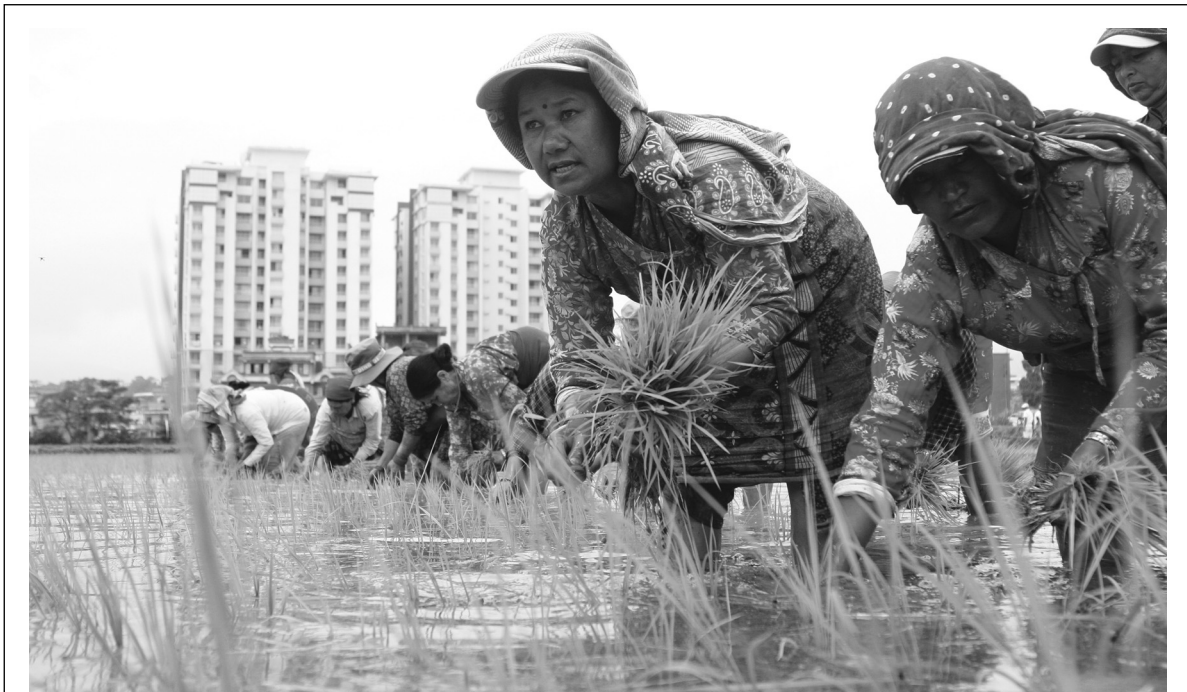
वलिपुरस्थित धापाखेलमा रोपाईं गर्दै महिलाहरू। वर्षायाम शुरू भएलगत्तै धान रोपन शुरू गरिन्छ भने केही वर्षयता खेतीयोग्य जमिनमा ठूला साना भवन तथा हाउजिड निर्माण कार्य गरिएकाले धान रोप्ने खेत घट्दै गएको छ।