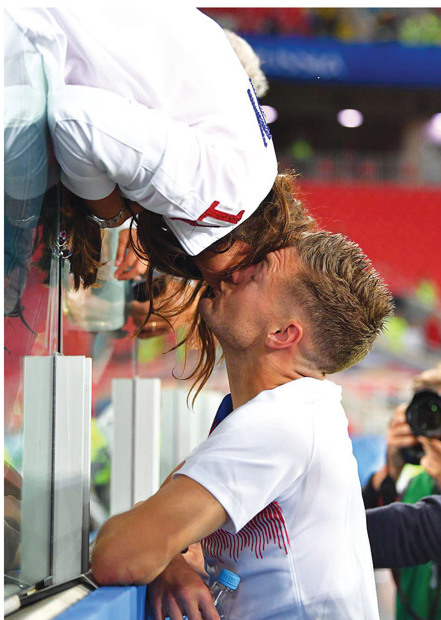
इंग्ल्यान्डले कोलम्बियाविरुद्ध जित हात पारेपछि इग्लिस खेलाडी जेमी भाडी आफ्नी श्रीमतीसँग माया साट्दै।