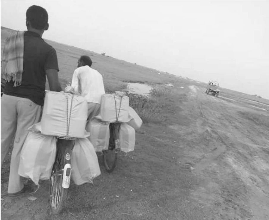
सप्तरीबाट भारततर्फ मदिरा तस्करी गरिदै।

भा रतको विहार राज्यमा सराबबन्दीको कानुन लागू भएपछि सीमावर्ती नेपाली भू-भागमा मदिराको बिक्रीवितरण तथा अवैध निर्यात बढेको छ। सीमावर्ती क्षेत्रका पसलमा मदिरा सेवन गरी घर फर्कने तथा नेपालमा रहेका आफन्तको घरमा पाहुनाको रूपमा बसेर मदिरा सेवन गर्ने क्रमसमेत बढेको हो। भारतीय नागरिकको ओहोर-दोहोर बढेपछि विहारसँग सीमा जोडिएका सीमावर्ती क्षेत्रमा गैरकानुनीरूपमा मदिराको बिक्रीवितरण र सेवन बढेको स्थानीय बताउँछन्। उनीहरूका अनुसार अधिकांश सीमावर्ती बजारमा मदिराका पसल खुलेको क्रम पनि बढेको छ। दसगजा क्षेत्रभित्रै पनि मदिराका पसल सञ्चालन भइरहेको उनीहरू बताउँछन्। सप्तरीका राजगढ गाउँपालिकाअन्तर्गतको बढीती तथा भुट्टी-बनैनीयाँ क्षेत्रमा दसगजा क्षेत्रभित्रै मदिरा पसल सञ्चालनमा आएको स्थानीयले जानकारी दिए। विभिन्न नाका हुँदै मदिराको अनाधिकृत निकासीसमेत बढेको छ। मदिरा निकासीका लागि साइकल र मोटरसाइकलको प्रयोग अधिक छ। चक्के सवारीसाधनमाफर्त पनि लुकीचोरी मदिराको निकासी हुने गरेको छ। सवारीसाधनमा प्रहरीको निगरानी बढेपछि पछिल्लो समय गोर्खाडा