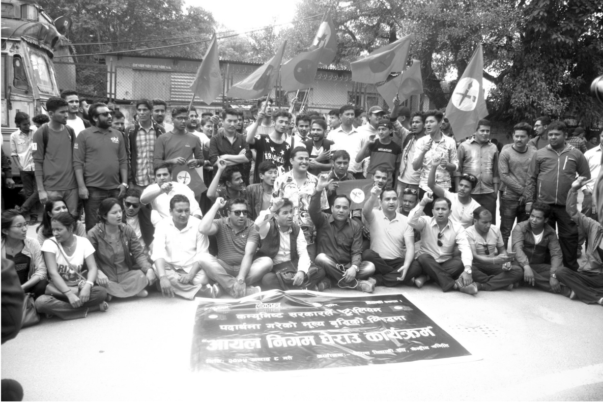
नेपाल विद्यार्थी संघको आयोजनामा पेट्रोलियम पदार्थमा गरेको मूल्यवृद्धिको विरुद्धमा काठमाडौंको नेपाल आयल निगमको कार्यालय बबरमहलमा घेराउ गरिएको छ।