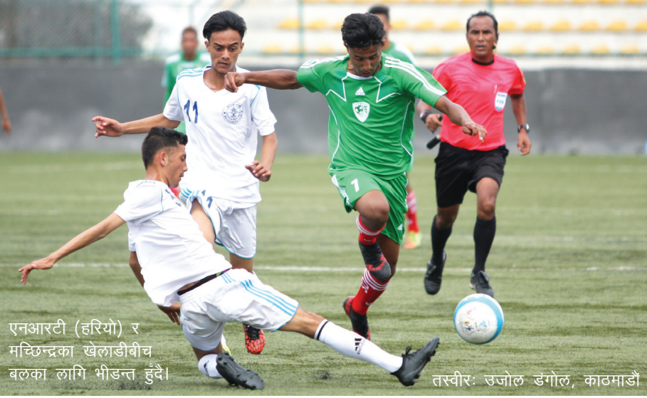
एनआरटी (हरियो) र मच्छिन्द्रका खेलाडीबीच बलका लागि भीडन्त हुँदै।