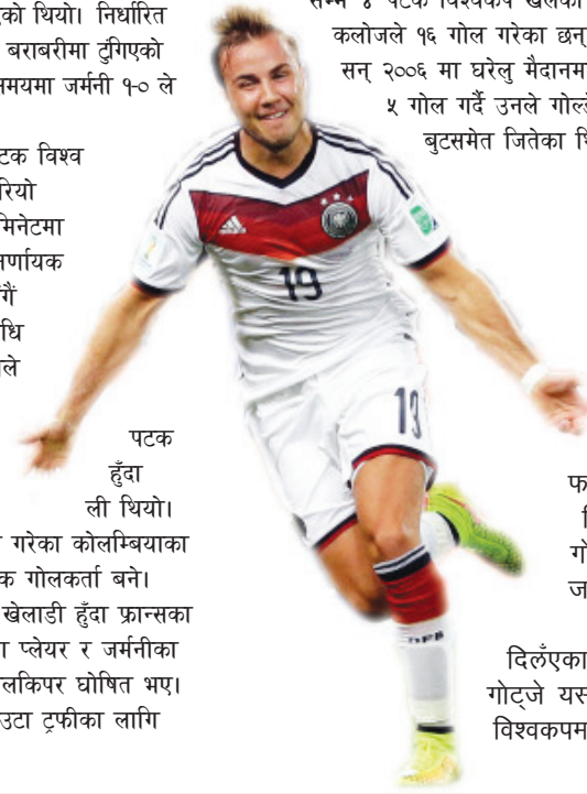
फाइनलमा निर्णायक गोल गरेर जर्मनीलाई उपाधि दिलाएका मारियो गोट्जेले यसपालीको विश्वकपमा छनोट भएपनि

सन् २००६ मा घरेलू मैदानमा ५ गोल गर्दै उनले गोल्डेन बूटसमेत जितेका थिए।