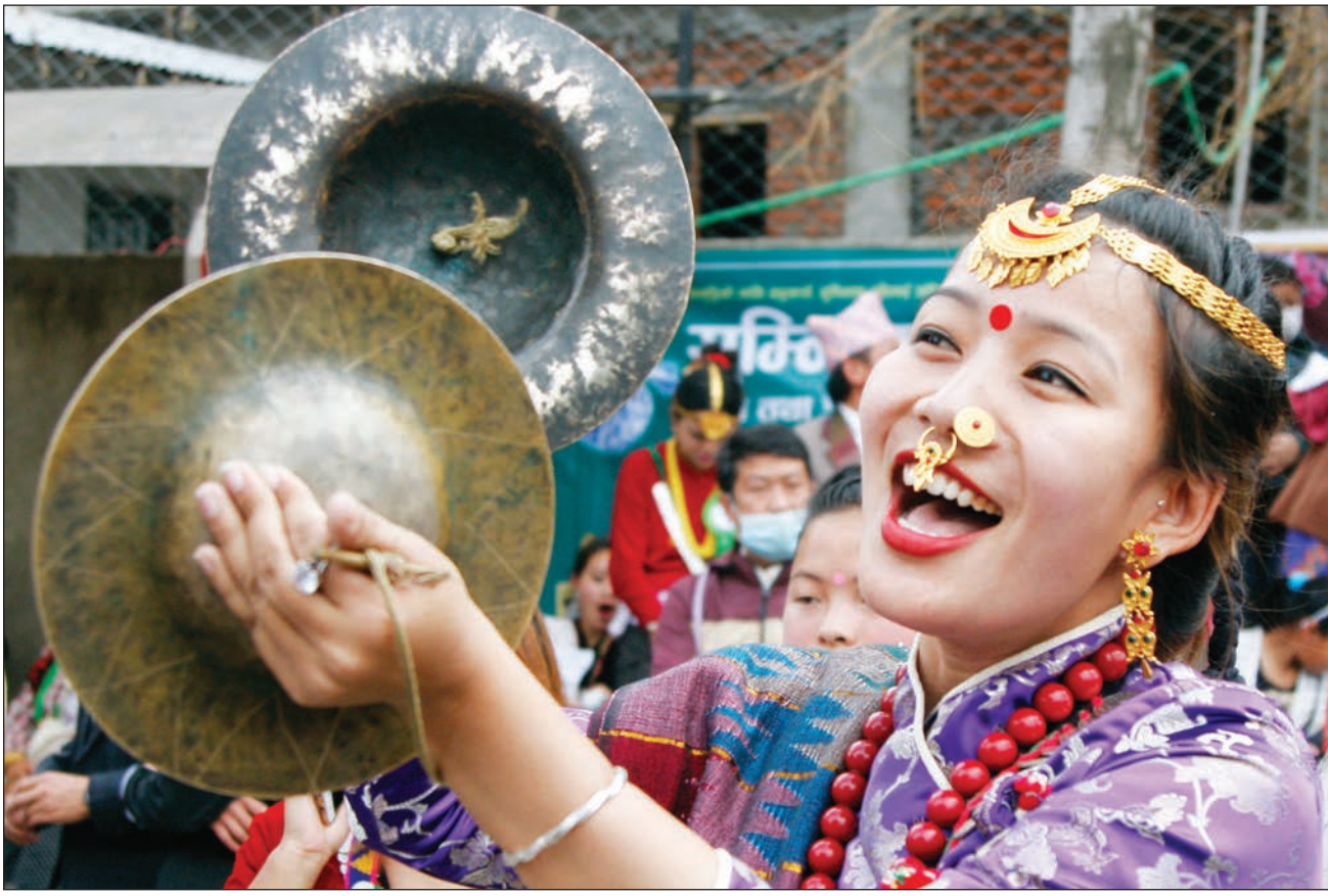
उभौली पर्वका सन्दर्भमा ललितपुरको नखिपोटमा आयोजित सांस्कृतिक कार्यक्रममा सहभागी किराँती समुदायका महिला ।

१० { करिब ८ सय जनाले हिमाल आरोहणको अनुमति लिए